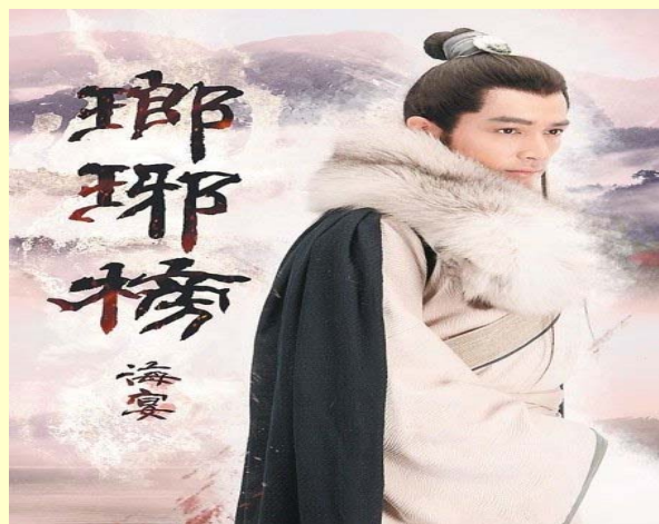
《琅琊榜》電子書版，方便隨身閱讀收藏。